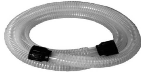
① 吐出ホースクミ 1.5m×1本