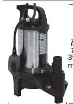
幅410mm(フロート使用時)