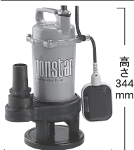
幅362mm(フロート使用時)